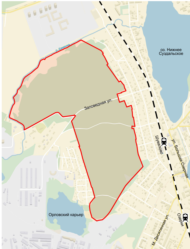
Схема границ заказника