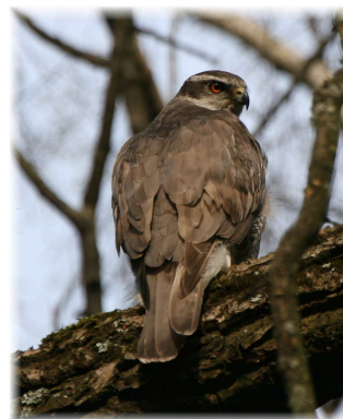
Ястреб-тетеревятник (вид Красной книги СПб)

В настоящее время заказник испытывает большую нагрузку со стороны отдыхающих. В связи с этим просим вас уважительно и бережно относиться к природе!