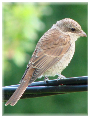
Молодой сорокопут-жулан (вид Красной книги СПб)

Своё название заказник получил от некогда располагавшегося здесь Орловского леса – владения графа А.Ф. Орлова-Денисова-Никитина. В начале XX в. территория заказника была почти полностью покрыта лесом. В 1920-е – 1930-е гг. окружающая лесной массив территория подверглась сильным изменениям: была начата разработка двух песчаных карьеров – Орловского и Шуваловского, построен асфальтобетонный завод и другие предприятия, сооружён военный аэродром, проложена автомагистраль, получившая название Заповедной улицы. В годы Великой Отечественной войны почти весь оставшийся лесной массив был