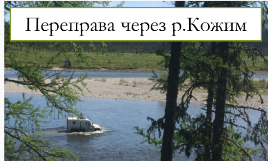
Переправа через р.Кожим