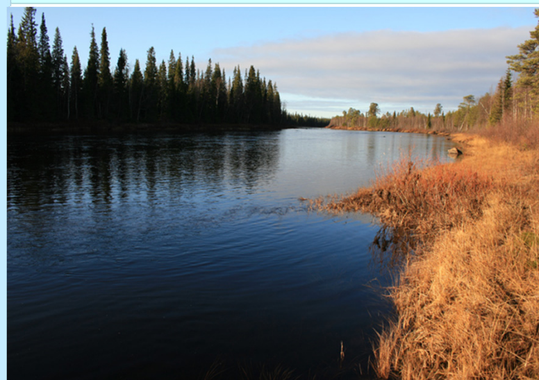
Национальный парк «Терский берег»