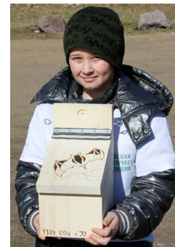
Один из вариантов домиков для летучих мышей

Для соединения деталей и крепления домика вам понадобятся: садовая проволока или металлический трос, саморезы.