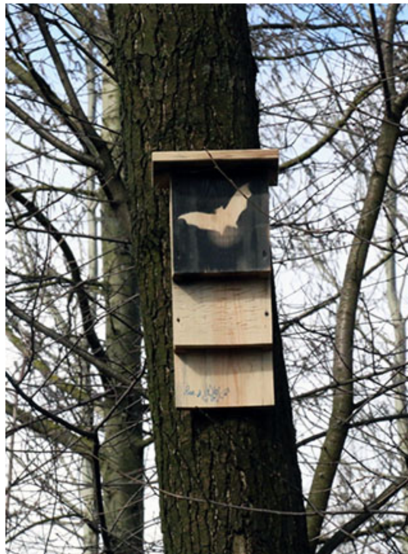
Домик для летучих мышей, установленный на дерево

Руководство подготовлено ГКУ «Дирекция особо охраняемых природных территорий Санкт-Петербурга» в 2016 году.