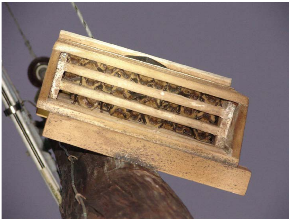
Вид заселенного рукокрылыми домика снизу