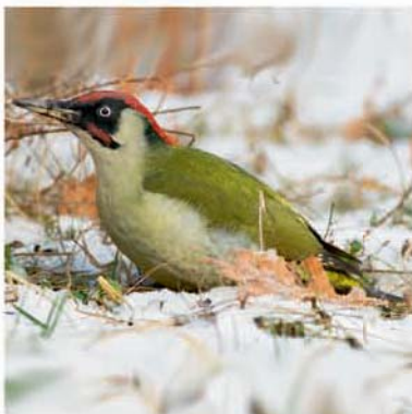
Зеленый дятел (вид Красной книги СПб)

Флора памятника природы «Парк «Сергиевка» отличается богатством. Здесь встречаются 439 видов дикорастущих и 102 вида культурных и заносных растений. Весной под пологом леса можно увидеть многочисленные первоцветы, появляющиеся сразу после схода снега. На ООПТ произрастают широколиственные, черноольховые и смешанные леса; на мелководьях Финского залива распространены тростниковые заросли. Благодаря разнообразию ландшафтов здесь в разные годы отмечалось до 188 видов птиц и 35 видов млекопитающих. Фауна рукокрылых парка «Сергиевка» представлена 9 видами летучих мышей, что делает ее уникальной. Также отличительной особенностью парка является достаточно большое видовое разнообразие зимующих птиц. Например, поползень, являющийся символом ООПТ, ежегодно гнездится и зимует на территории памятника природы.