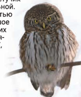
Воробьиный сыч (вид Красной книги СПб)

В настоящее время во дворце Лейхтенбергских и других парковых постройках «Сергиевки» располагаются лаборатории биологического факультета Санкт-Петербургского государственного университета.