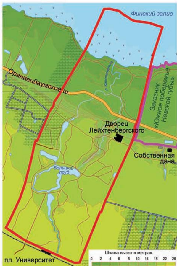
Схема границ памятника природы