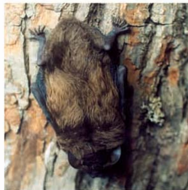
Рыжая вечерница (вид Красной книги СПб)

В настоящее время негативное влияние человеческой деятельности на ландшафты памятника природы выражено достаточно сильно. В связи с этим, просим вас уважительно и бережно относиться к природе!