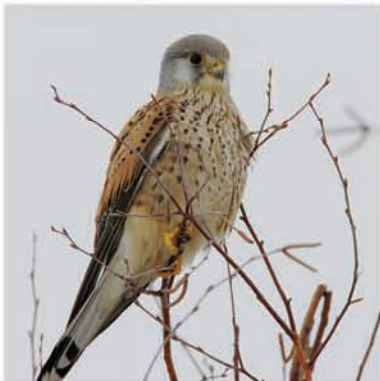
Пустельга (вид Красной книги СПб)

Поповка — небольшая речка, шириной в летнюю межень не более 4 метров — за свою 10000-летнюю историю образовала каньонообразную долину с многочисленными обнажениями горных пород. Это единственное место на территории Санкт-Петербурга,