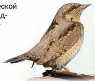
Вертишейка (вид Красной книги СПб)